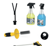
FOR FREE 1x 283999

Preisangaben in €, zzgl. MwSt, Verpackungs- und Transportkosten. Zahlbar 10 Tage rein netto, vorbehaltlich Bonitätsprüfung. Mindestbestellwert 50 €. Technische Änderungen vorbehalten. Ab Lager Oberottmarshausen. Weiterverkauf vorbehalten. Es gelten unsere allgemeinen Geschäftsbedingungen. Preisänderungen und Druckfehler vorbehalten.